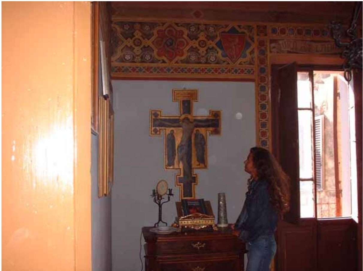
Figura 5 - Altra vista dello studio