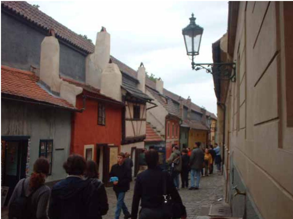
Figura 15 - Lo Zlatá ulička (Vicolo d'oro)

Dopo una breve visita alla chiesa e al convento di san Giorgio (sv. Jiří), anch'esso all'interno del Hrad, raggiungiamo finalmente il famoso Zlatá ulička (vicolo d'oro), così detto perché anticamente sede di botteghe di orafi. La leggenda, che ama circondare Praga di un alone di mistero, narra che in questo vicolo vissero dei maghi che tra l'altro usavano la pietra filosofale per fabbricare l'oro. Oggi purtroppo non ci sono più né orafi né maghi, ma solo botteghe di ciarpame per turisti; la visita è d'obbligo, giusto per vedere una cosa di cui tutti parlano, ma, una volta fatta, il luogo è da evitare accuratamente.