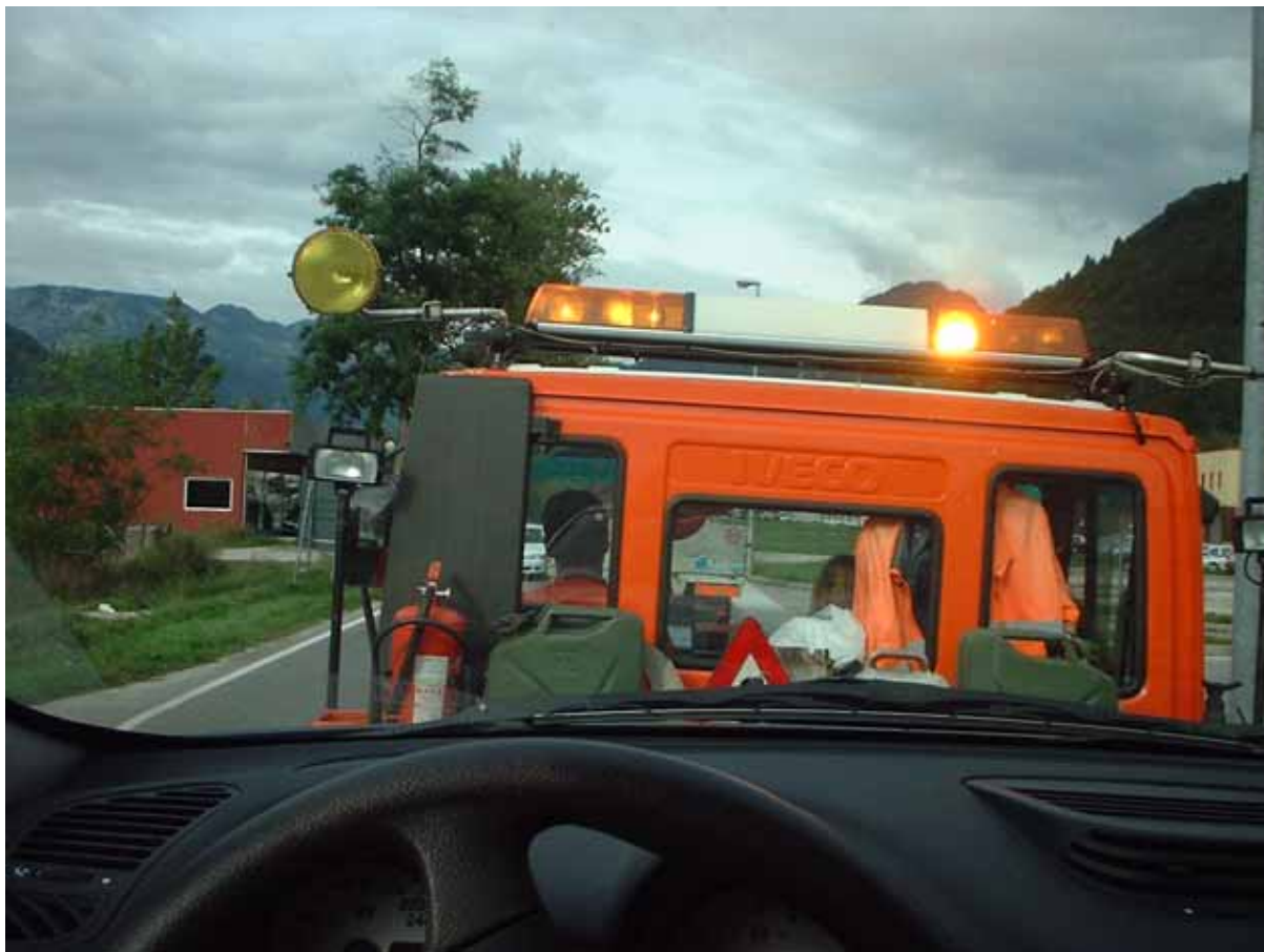
Figura 22 - Sul carro attrezzi in viaggio verso Tolmezzo

posizione orizzontale e possiamo ripartire; destinazione: l'officina Alfa Romeo di Tolmezzo. Vi arriviamo dopo un breve viaggio di meno di venti minuti. Qui l'auto viene scaricata ed io posso scendere. Un solerte meccanico la spinge verso l'officina e Cae e Ciz lo seguono, mentre io rimango presso il carro attrezzi per prezzolare l'autista di quasi duecentomila lire (non sono socio ACI), ricevendone in cambio una bella ed inutile fattura.