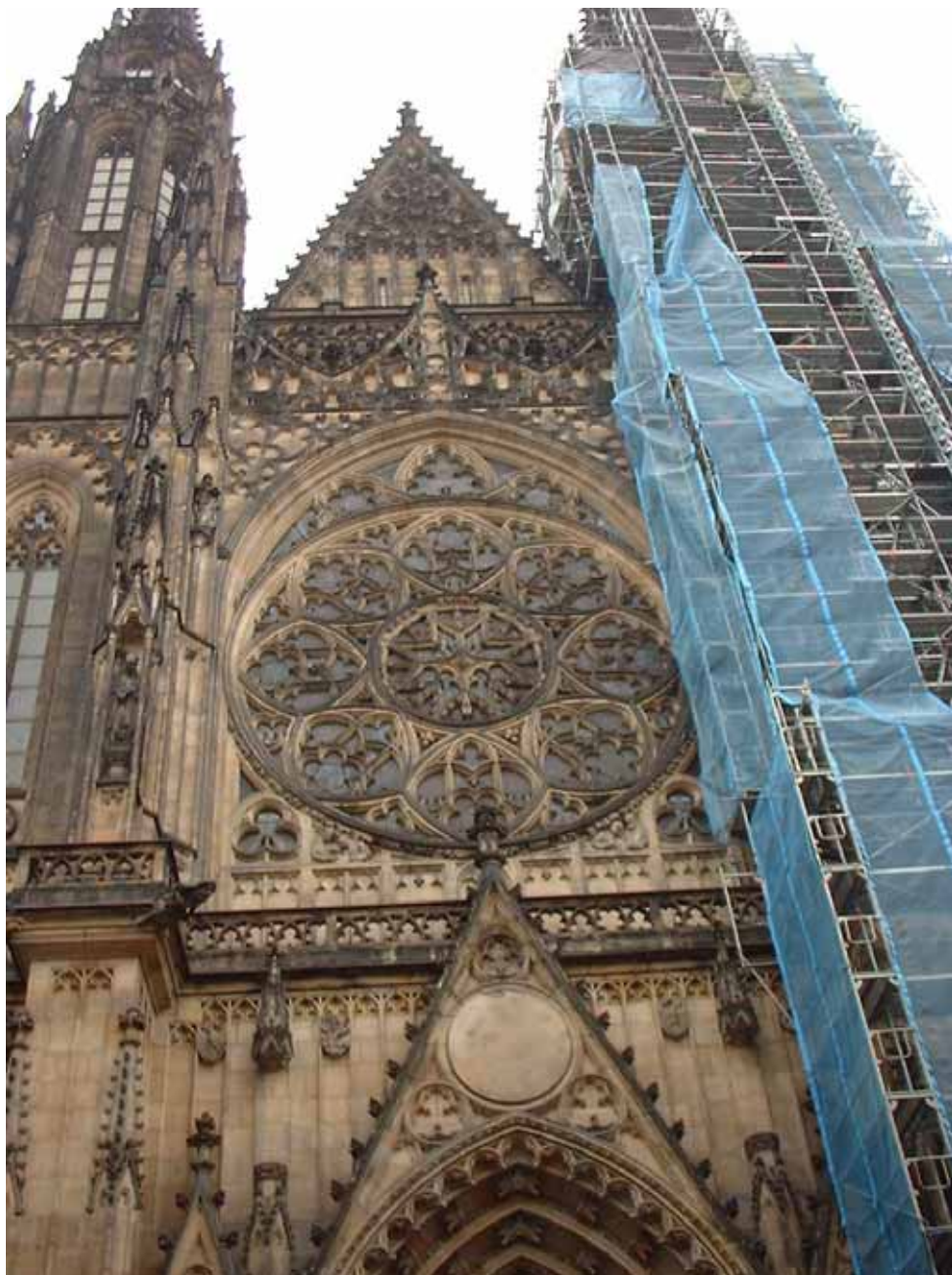
Figura 14 - La facciata della cattedrale di San Vito

Alle loro spalle, proprio sopra l'ampio portone di ingresso, si nota la bandiera ceca a mezz'asta, a causa del lutto per l'attentato di New York. Entriamo nel primo cortile e mi rendo subito conto che le indicazioni della guida verde del Touring non sono sufficienti per effettuare una visita ad un tempo rapida e completa. Noto però che nella sala della biglietteria noleggiavano dei registratori portatili multilingue, molto simili a quelli del castello di Salisburgo. Ne prendo tre e, dopo esserci caricati, oltre che dei registratori, di un paio di piantine del castello, iniziamo la visita, incominciando dalla cattedrale di San Vito. Si tratta di un superbo edificio gotico, tanto alto che è difficile fotografarne la facciata dall'angusta piazzetta antistante.