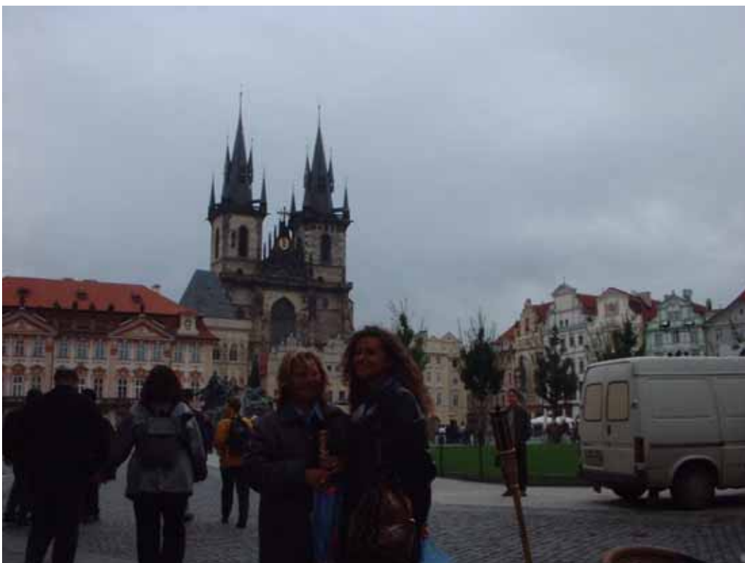
Figura 13 - Il tempio di Týn