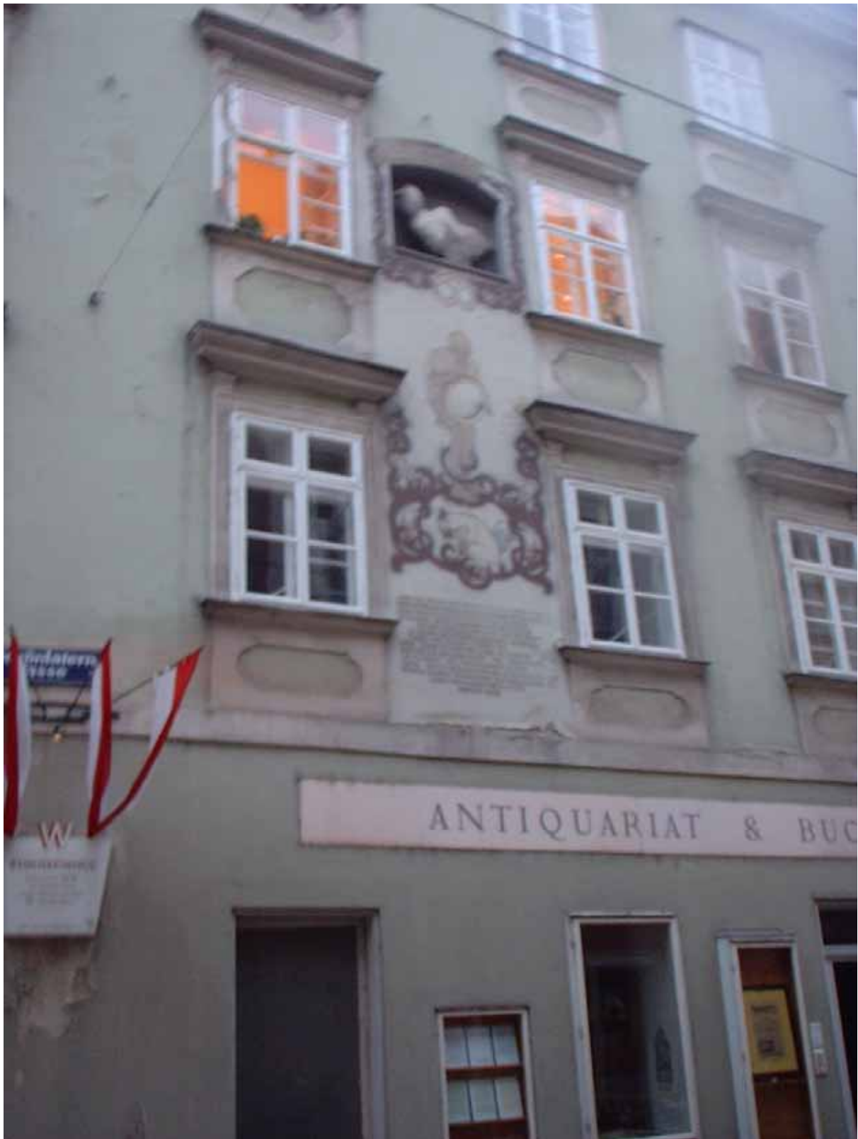
Figura 18 - La Basiliskenhaus

così che il garzone ebbe l'idea di presentarsi al basilisco con uno specchio. La bestia, vistasi riflessa in esso, fu uccisa dal suo stesso sguardo e la casa e tutto il quartiere furono liberati. Il garzone ebbe in premio niente meno che la mano della figlia del fornaio e... vissero felici e contenti.