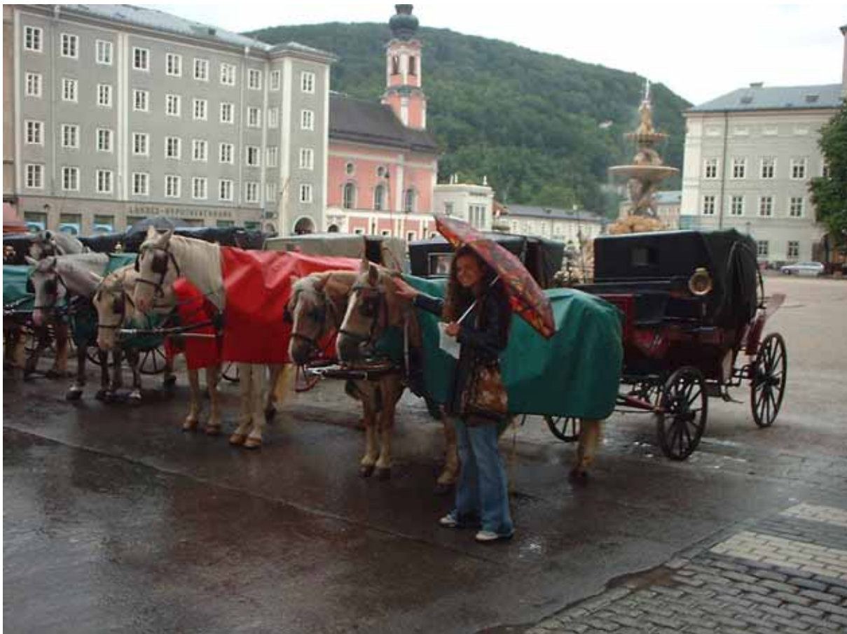
Figura 10 - Salisburgo. La Residenzplatz