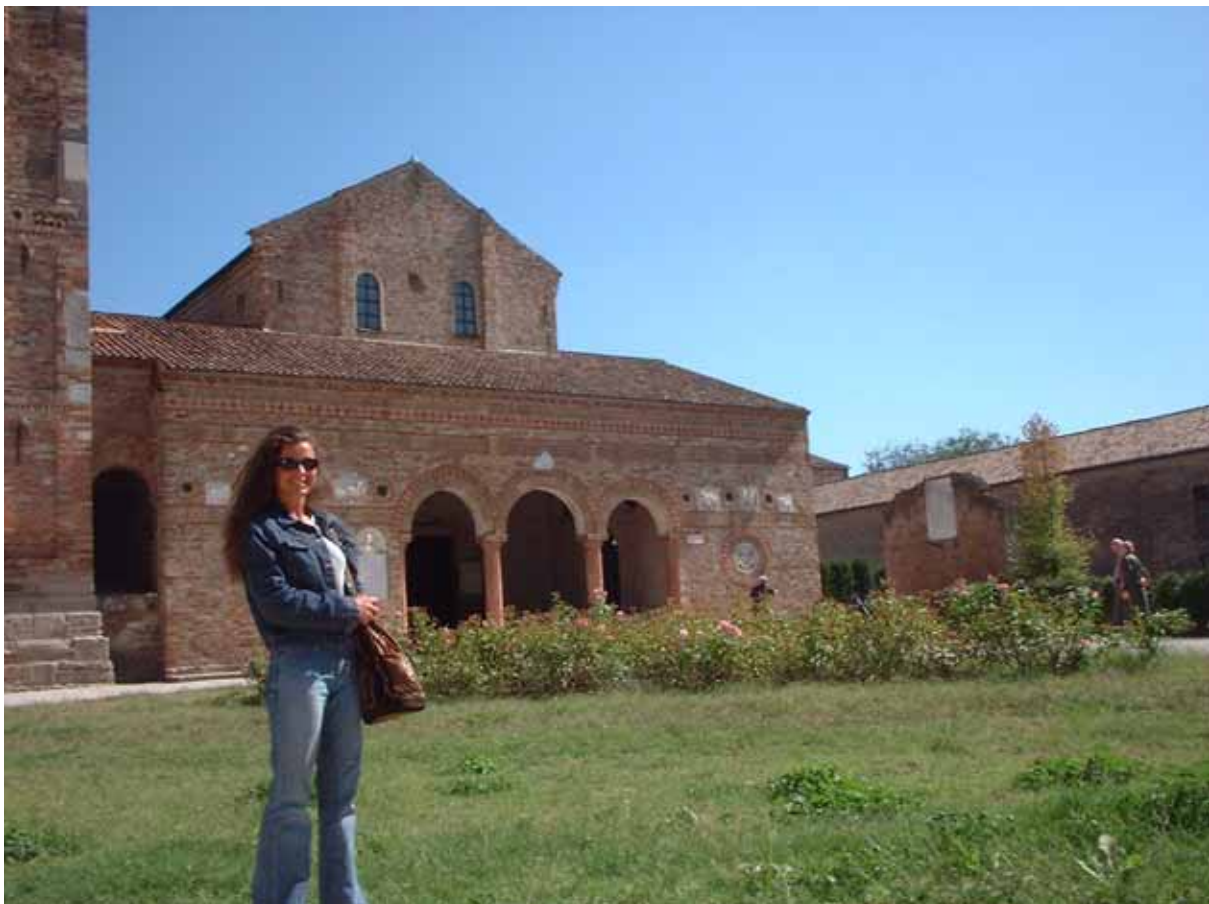
Figura 7 - Abbazia di Pomposa