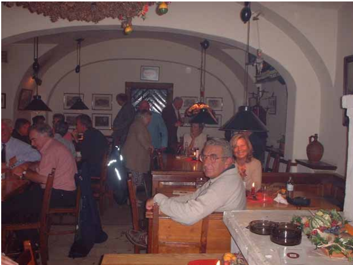
Figura 21 - A cena da Gigerl

Torniamo a casa, cioè all'Hotel Capri, e ci addormentiamo subito. Anche questa, come tutte le altre, è stata una lunga giornata.