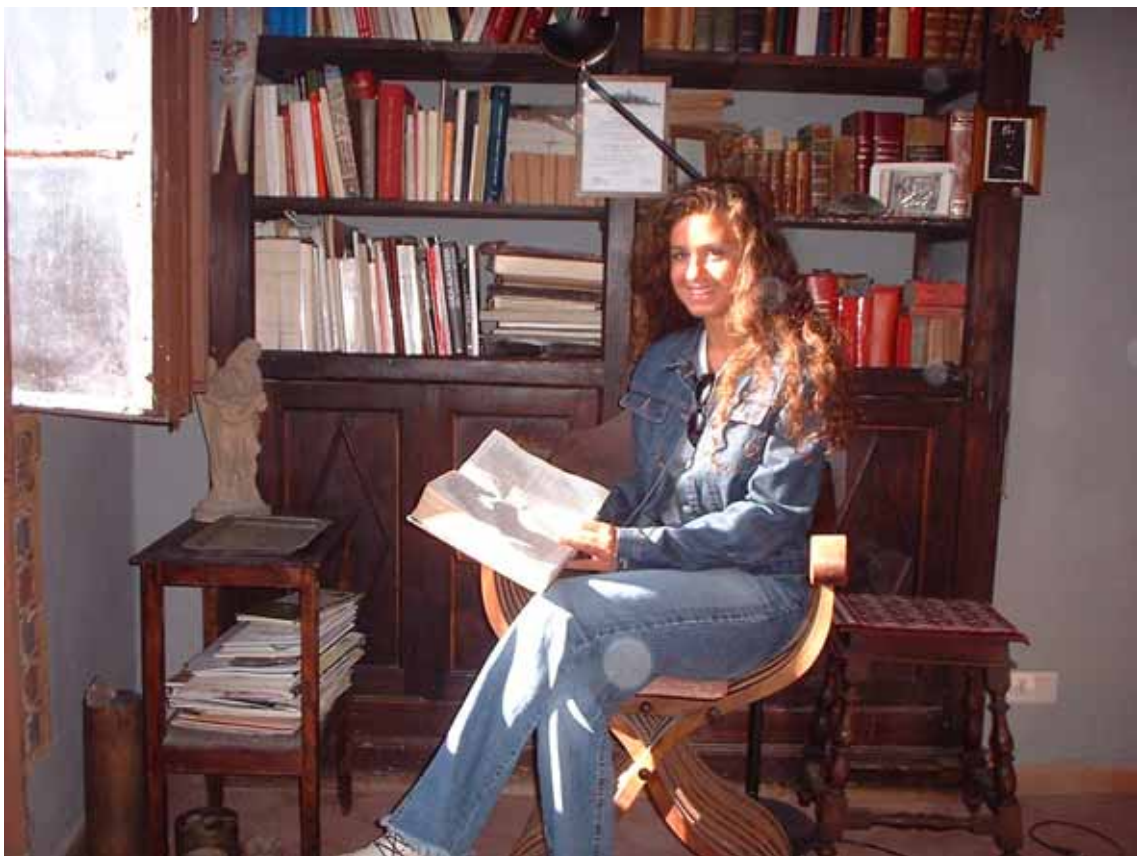
Figura 6 - Ancora la libreria