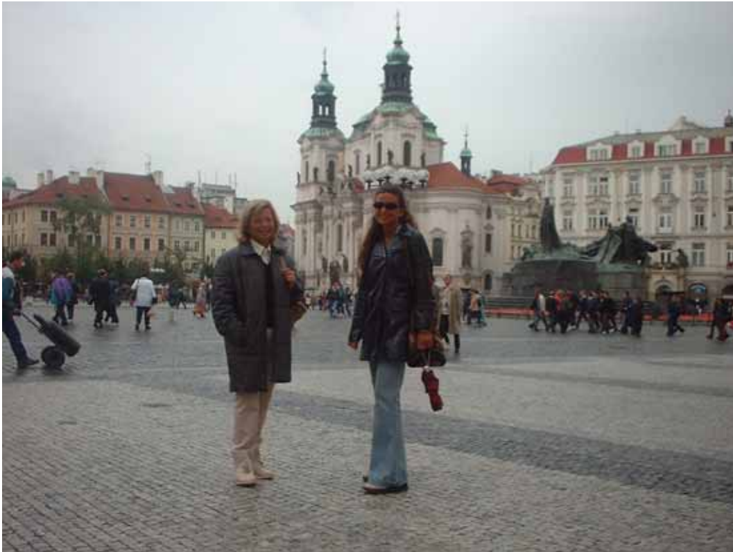
Figura 12 - La Staroměstské Náměstí (piazza della Città Vecchia) con la chiesa di sv. Mikuláš e il monumento a Jan Hus

insieme con il cavetto nella tasca del mio giaccone, a sera mi permetterà di accendere il portatile e prenderà dimora permanente nella borsa di pelle del portatile stesso.