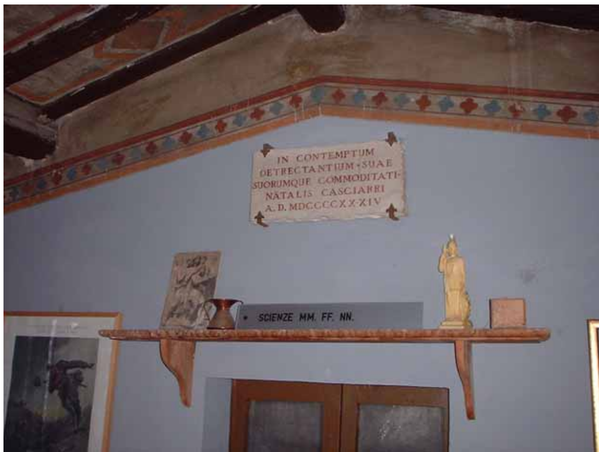
Figura 23 - Il motto della casa nella soffitta di via Francolina

Anche se non è necessario, apro anche la porta in cima alla scaletta di ferro sul balcone, che conduce all'appartamento superiore, ricavato nella soffitta. Conduco Ciz a visitarlo e le mostro la stanza a vetri sul tetto, dove, sulla porta dell'antico colombario, fa bella mostra di sé la frase latina che lo zio di Uccio, il canonico Natale Casciarri, volle imprimere, quasi fosse il motto della casa, e che Uccio traspose per la sua villa di Seiano, sostituendo il proprio nome a quello dello zio e affidandone la memoria non al marmo, ma a delle maioliche nel giardino della villa. 2