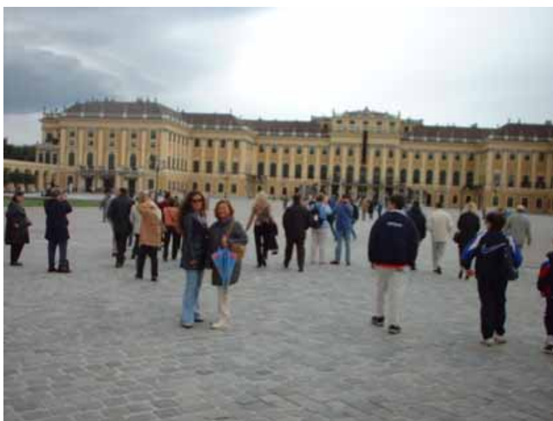
Figura 20 - Ehrenhof di Schönbrunn