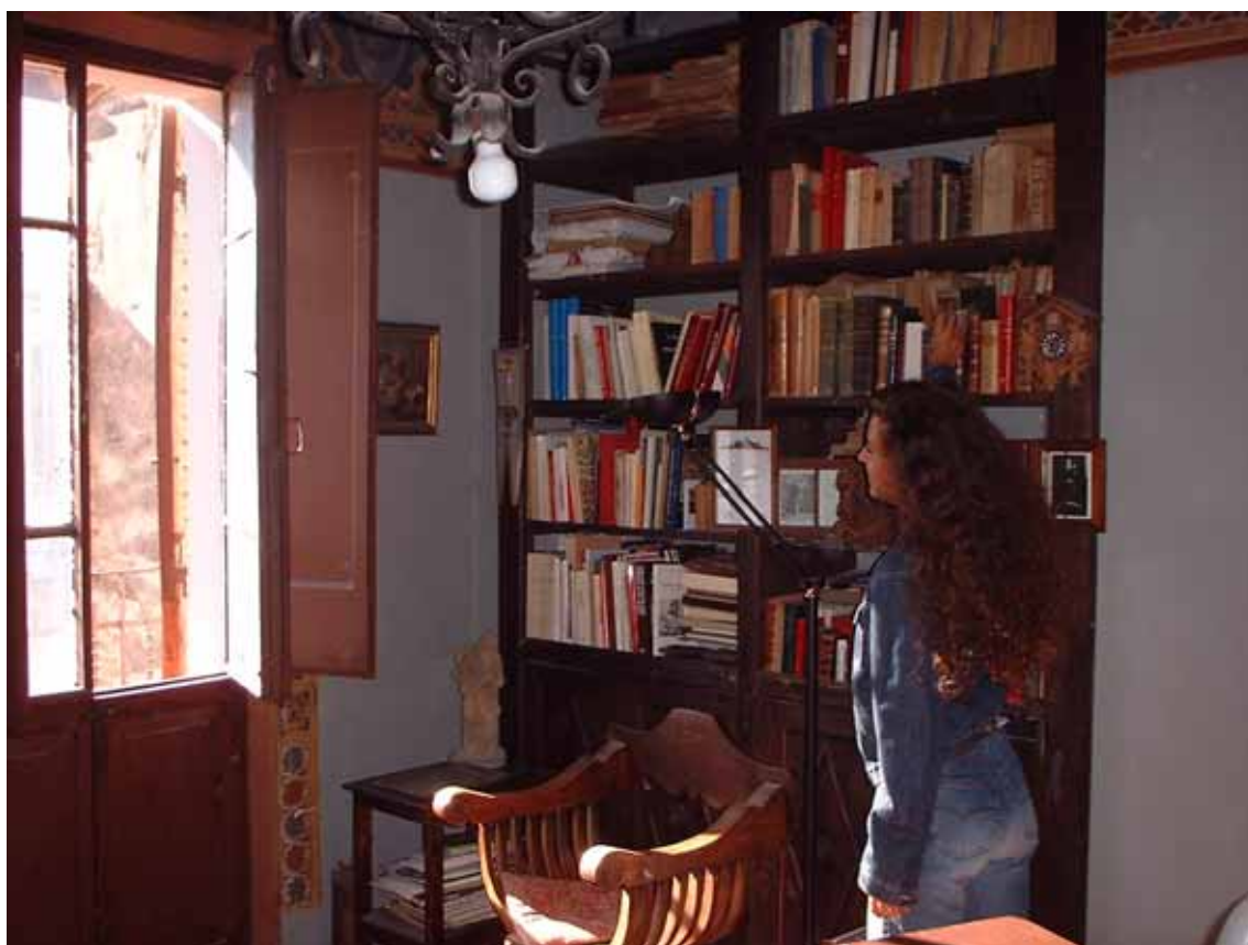
Figura 4 - La libreria nello studio di Perugia