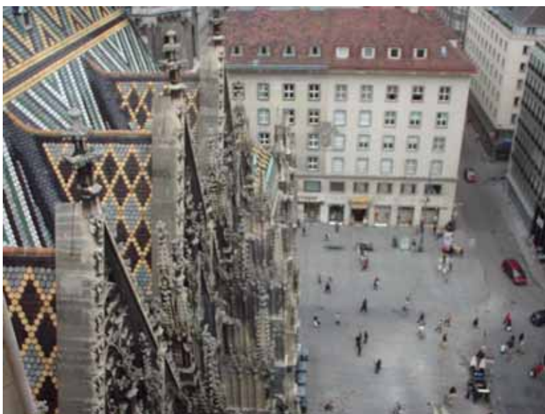
Figura 17 - Panorama della Stephanplatz dalla Adlerturm

Mi rendo conto ora, che l'anno scorso, quando avevo visitato per la prima volta il duomo di Santo Stefano, non ero riuscito a vedere l'autoritratto di Pilgram, ma l'avevo scambiato per un altro personaggio raffigurato più in alto sul pulpito, che somigliava un poco a Zillo.