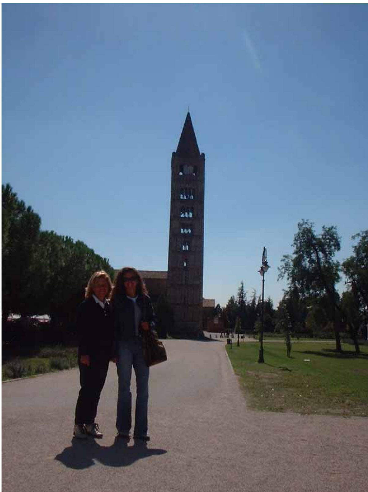
Figura 8 - Abbazia di Pomposa

Ripartiamo quando sono già le due. Il traffico della Romea è, come al solito, infernale, a causa degli autotreni da cui è letteralmente infestata. Verso le quattro arriviamo alla circonvallazione di Venezia, che, fortunatamente e contrariamente al solito, è abbastanza sgombra. Durante una sosta ad un'area di servizio subito dopo Venezia, verifico i chilometri che mancano a Salisburgo e, constatato che sono poco più di duecento, sciolgo ogni dubbio e