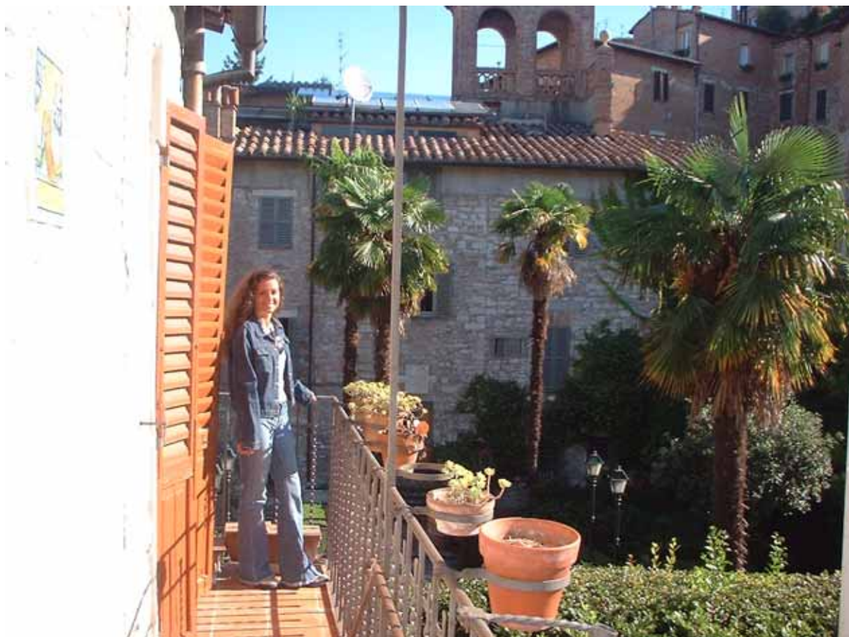
Figura 2 - Il balcone della casa di Uccio a Perugia

Ci prepariamo e decidiamo di lasciare le lenzuola e gli asciugamani a casa di Uccio, così al ritorno potremo fare di nuovo tappa qui ed inoltre viaggeremo più leggeri, evitando di intasare il bagagliaio con cose inutili. Prima di muoverci, però, faccio visitare a Ciz, che non l'ha vista ancora, la casa di Uccio e scatto anche un bel po' di fotografie, approfittando della bella giornata di sole.