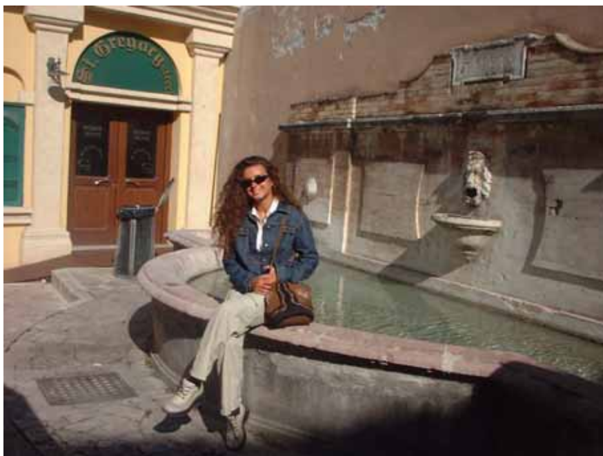
Figura 24 - La fontana "Et anni et undae"