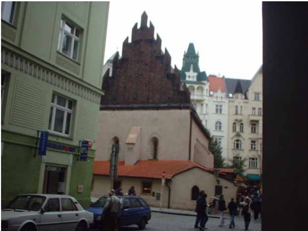
Figura 16 - La sinagoga Staronova

Raggiungiamo finalmente la prima sinagoga, la Staronova (vecchia nuova), che è proprio quella dove, secondo la leggenda, il rabbino Leone aveva dato vita al Golem. Si tratta di un edificio modesto, dall'aspetto quasi rustico, niente affatto invitante, ma la visita è comunque d'obbligo. All'ingresso - manco a dirlo - c'è la biglietteria e il prezzo - manco a dirlo - è piuttosto notevole e per di più, come se non bastasse, un solerte impiegato distribuisce a tutti gli uomini uno zucchetto ebreo (di carta) da indossare prima di entrare. La cosa mi disturba alquanto, ma la sana curiosità turistica deve essere soddisfatta ed inoltre, dato che predico la tolleranza (più che mai necessaria in questi giorni tragici), mi inchino allo zucchetto ed entriamo. Per inciso, il fatto che esso sia di carta farebbe sperare che sia "usa e getta"; invece no: all'uscita deve essere restituito in modo che altri malcapitati possano indossarlo. Alla fine della storia la sinagoga si rivela come una squallida stanza nuda, con una fila di sedie e banchi di legno addossati alle pareti, su cui giacciono al momento un po' di turisti inglesi sconsolatamente all'ascolto di una guida in lingua. Ci affrettiamo a uscire, leggermente delusi e convinti di non aver avuto un buon ritorno dal nostro investimento finanziario.