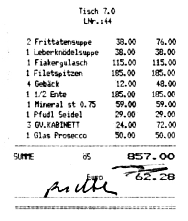
Figura 19 - Il conto del ristorante Gasthaus Pfudl

Cae e Ciz si addormentano subito, mentre io non rinuncio alle ultime notizie di RAI1 sulla situazione di New York. Dopo un po' però anch'io cedo al sonno: domani la giornata sarà dedicata alla visita della reggia di Schönbrunn. Sarà una giornata importante, perché sarà una giornata in più strappata al programma iniziale.