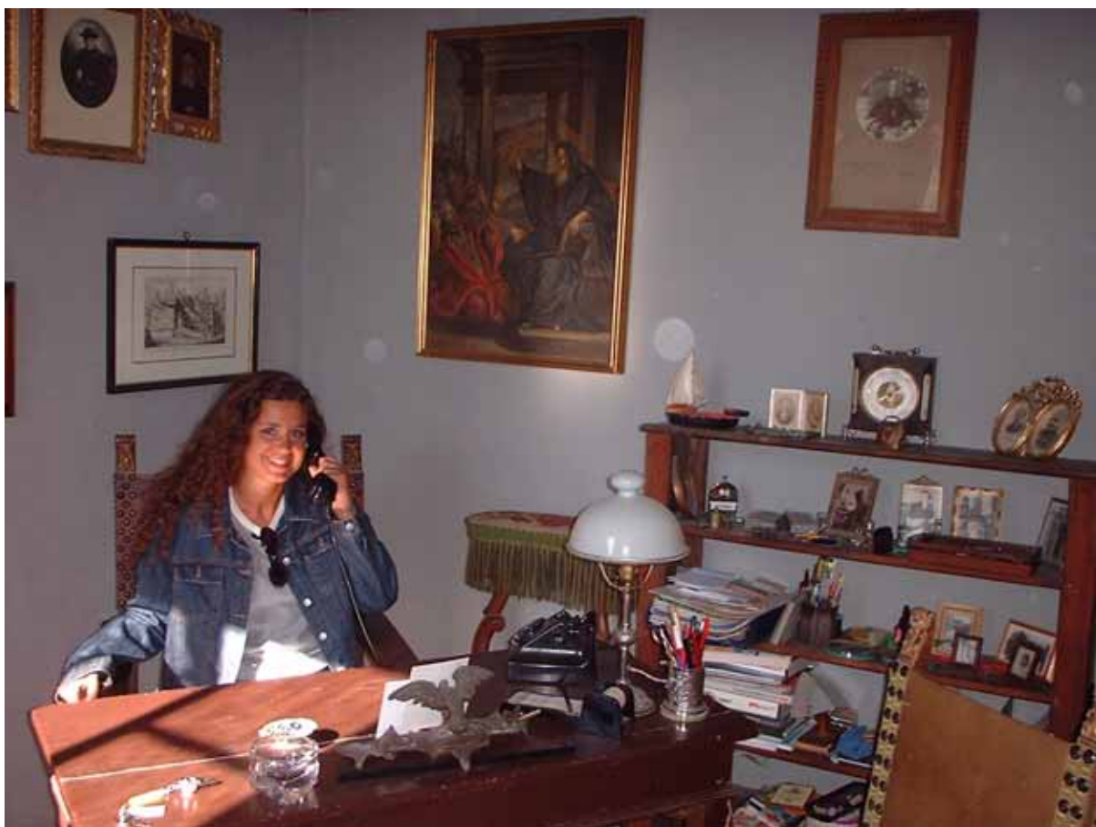
Figura 3 - Lo studio di Perugia