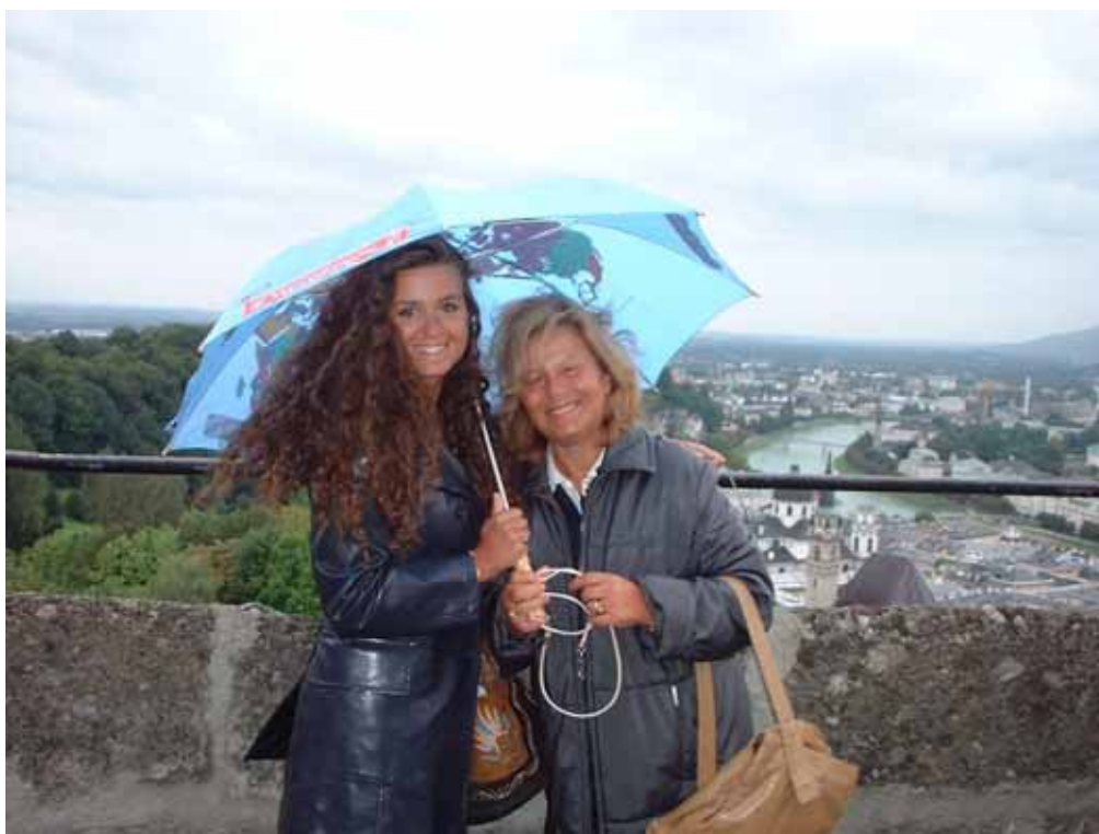
Figura 9 - Sulla terrazza di Hohensalzburg

Secondo il nostro standard, sono abbondantemente passate le dieci quando usciamo dall'albergo. Poiché dobbiamo visitare ancora Salisburgo, ci viene concesso di tenere ancora le camere fino alle 12-13, quando contiamo di partire. Ci avviamo direttamente alla funicolare per la fortezza di Hohensalzburg (Salisburgo alta), cioè per il castello dei principi-vescovi, che domina la città vecchia. Alla biglietteria della funicolare ho la sorpresa di veder rifiutata qualsiasi carta di credito: sono costretto a cambiare un po' di soldi, in maniera ovviamente svantaggiosa. Comunque saliamo e, arrivati sulla terrazza panoramica, dobbiamo aprire l'ombrello, perché comincia di nuovo a piovere. Ci avviamo alla biglietteria del castello, dove acquistiamo i biglietti e prendiamo i "telefoni guida" che vengono usati per ascoltare la spiegazione per i vari ambienti da visitare. In ogni sala bisogna impostare un numero di tre cifre: la prima è la lingua (3 per l'italiano) e gli altri due il numero dell'ambiente, indicato sul muro all'ingresso. Prima di entrare siamo costretti ad aspettare quasi un quarto d'ora, perché fanno passare prima di noi un gruppo di inglesi. Peccato, perché per noi il tempo è prezioso. Nell'attesa, esco con Ciz nel cortile interno del castello, perché nella sala della biglietteria si schiatta di caldo.